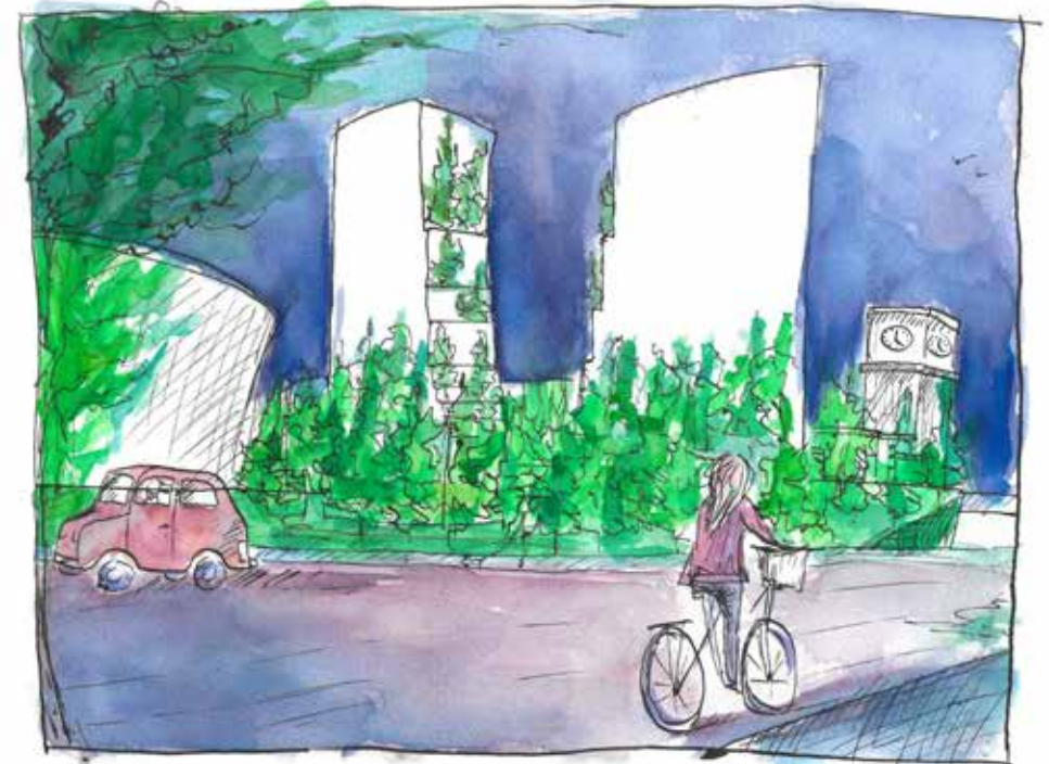
impressie, zicht vanaf Marconilaan

De slanke vorm van de torens zorgt ervoor dat het park zichtbaar is vanaf de ring. Ook blijft het Klokgebouw zichtbaar vanaf de ring en er is een doorkijk is tussen Limbeek en Strijp-S.