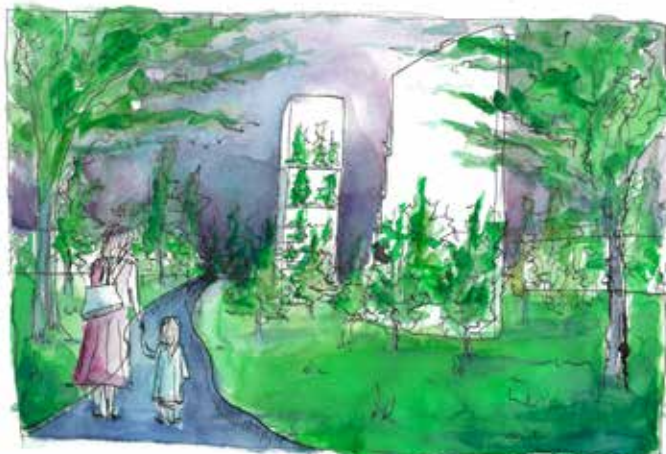
impressie, zicht vanaf park